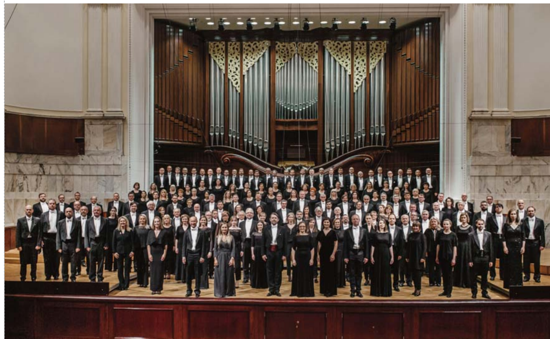
Chór i Orkiestra Filharmonii Narodowej

Dziś Orkiestra Filharmonii Narodowej cieszy się popularnością i uznaniem na całym świecie. Odbyła niemal 150 tournées na pięciu kontynentach, występowała w najważniejszych salach koncertowych świata. Zespół uczestniczył również w wielu prestiżowych międzynarodowych festiwalach, m.in. w Wiedniu, Berlinie, Pradze, Bergen, Lucernie, Montreux, Moskwie, Brukseli, Florencji, Bordeaux i Atenach, w Nantes (La Folle Journée), Bilbao, Lizbonie i Tokio. Orkiestra Filharmonii Narodowej regularnie towarzyszy finalistom Międzynarodowego Konkursu Pianistycznego im. Fryderyka Chopina, bierze udział w Festiwalu Muzyki Współczesnej „Warszawska Jesień”, Międzynarodowym Festiwalu „Chopin i jego Europa” czy Wielkanocnym Festiwalu Ludwiga van Beethovena. Nagrywa dla Polskiego Radia i Telewizji,