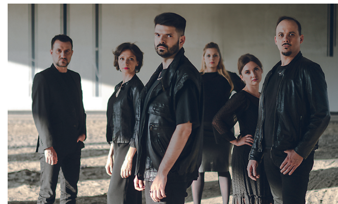
Sekstet Wokalny proMODERN

** Utwór pod tytułem Do zwycięstwa został zamówiony przez Fundację Pro Musica Viva we współpracy z Fundacją Most the Most oraz Bankiem Gospodarstwa Krajowego