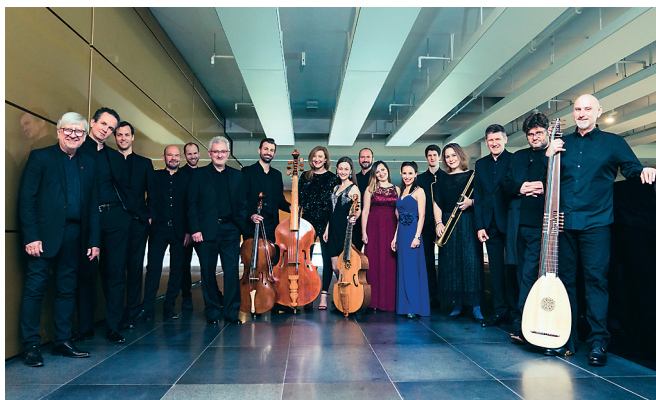
Wrocław Baroque Ensemble

Mykola Dylecki (1630?–1690?) – Liturgia żałobna na chór 8-głosowy – Kanon Zmartwychwstania na chór 8-głosowy