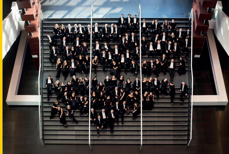
Orkiestra NFM Filharmonii Wrocławskiej