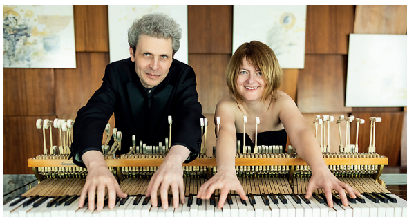
Kyiv Piano Duo